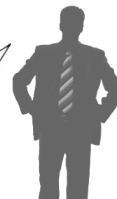
Клиентская служба банка